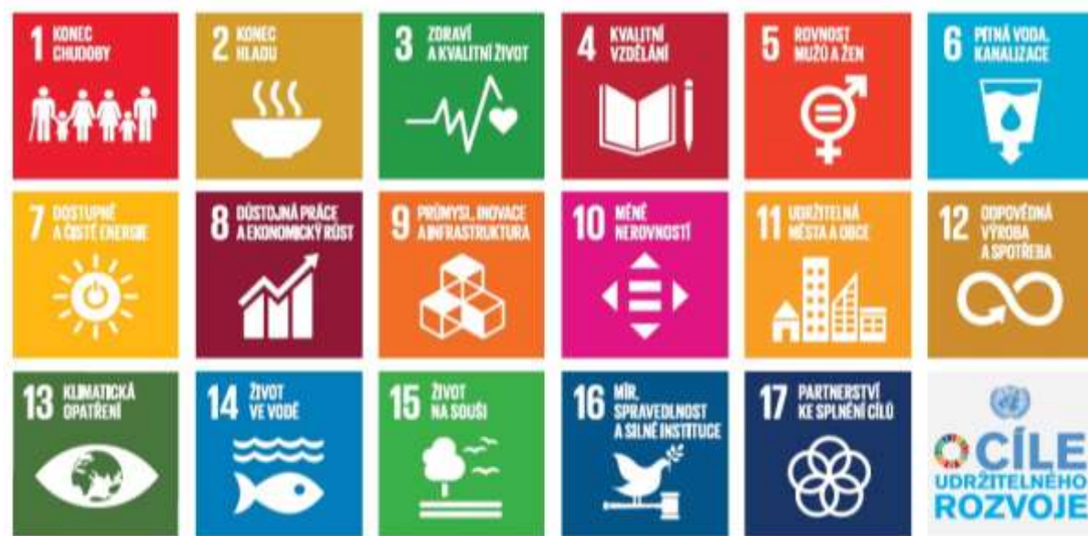
Obrázek 1: Cíle udržitelného rozvoje

Zdroj: https://www.osn.cz/osn/hlavni-temata/sdgs/