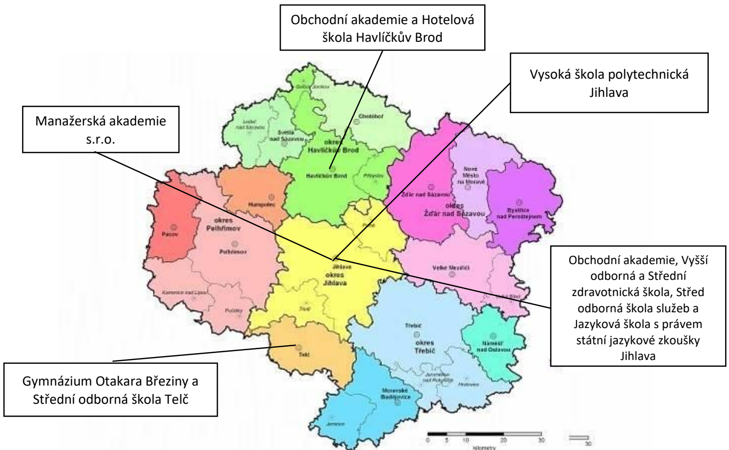
Obrázek 2: Mapa České republiky se zvýrazněním Kraje Vysočina