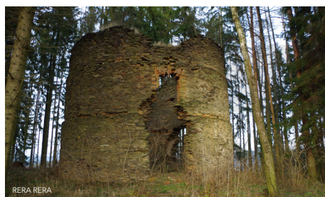
Větrný Mlýn Radvanov