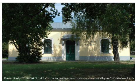
Wasserpumpwerk Landersdorf Krens