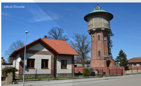
Třeboň Vodárenská Věž