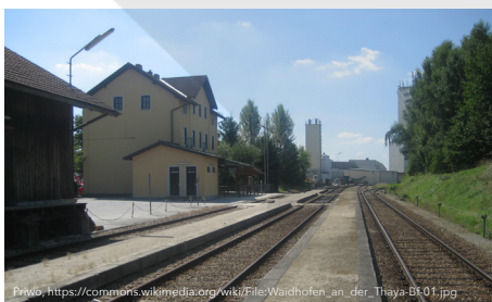
Thayatalbahn, Waidhofen an der Thaya