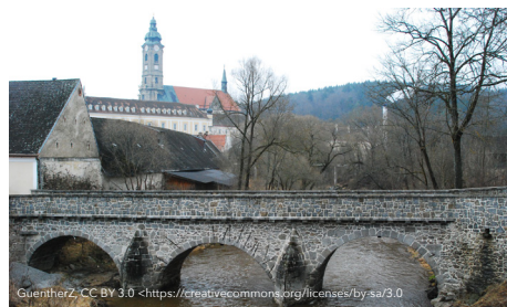
Alte Brücke, Stift Zwettl