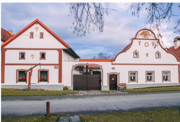
Hološovice na Českobudějovicku.

„Například v roce 2019 skončil projekt Památky žijí. Ten měl za cíl propagovat památky v regionu, jako jsou hrady, zámky, kláštery či města s hradbami. Vybrali jsme ty méně navštěvované, aby se počet turistů rozprostřel do různých koutů regionu, což je náš cíl,“ pokračuje Pavel Hložek.