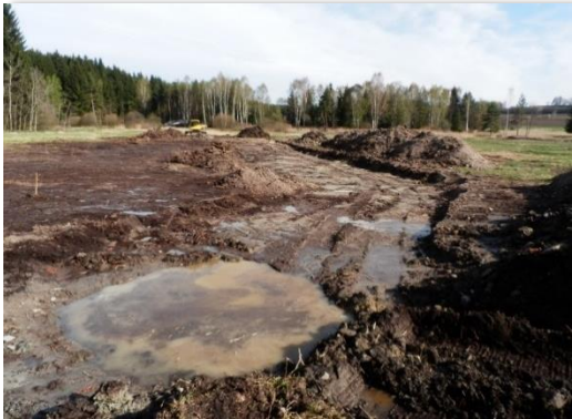
Tümpel (in Form von ortsüblichen kleinen Teichen). (V. Kodet)