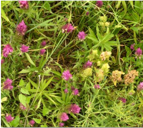
Zottiger Klappertopf (Rhinanthus alectorolophus; gelbe Blüten) – ein wirksames Instrument zur Bekämpfung invasiver und expansiver Pflanzenarten auf extensiven Rasen. (J. Těšitel)