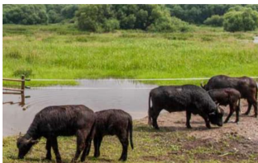
Büffelweide in der Aue der Lainsitz, im Naturschutzgebiet Lainsitzniederung. (A. Schmidt)