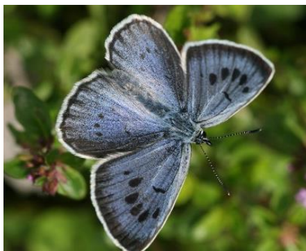
Eine in ganz Europa rückgängige und in CZ kritisch bedrohte Art – der Quendel-Ameisenbläuling.