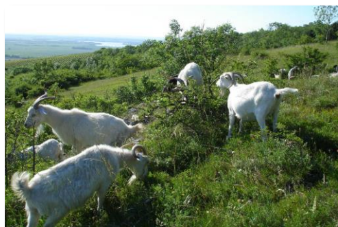
Kaschmirziegen auf den Pollauer Bergen, Mai 2011

Schäferei Podyjí, Ökofarm Jáňův dvůr farma.podyji@seznam.cz