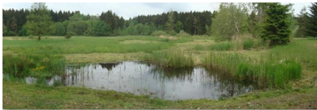
Ein Tümpel, der im Rahmen der Renaturierung der Moore und Torfwiesen im NSG Chvojnov errichtet wurde. (V. Kodet)