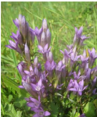
Der kritisch gefährdete Böhmische Kranzenzian (G. Bassler-Binder)