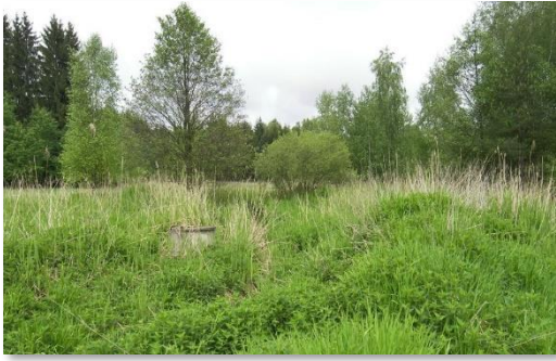
Brennesselbewuchs auf entwässerten Flächen vor der Renaturierung. (V. Kodet)