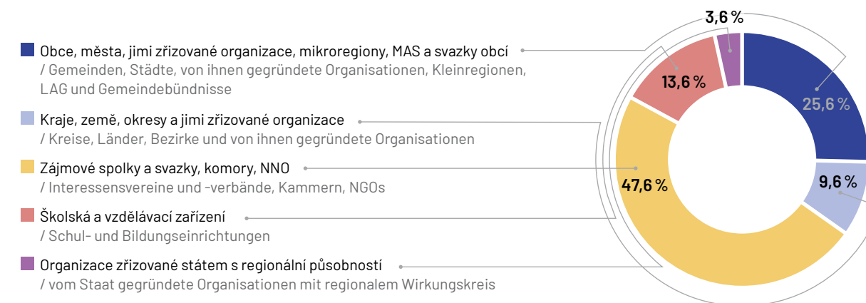
Malé projekty podle cílové skupiny žadatele / Kleinprojekte nach dem Typ des Antragstellers

Bei insgesamt 250 genehmigten Kleinprojekten ist davon auszugehen, dass sich dieser Indikator leicht erfüllen lässt.