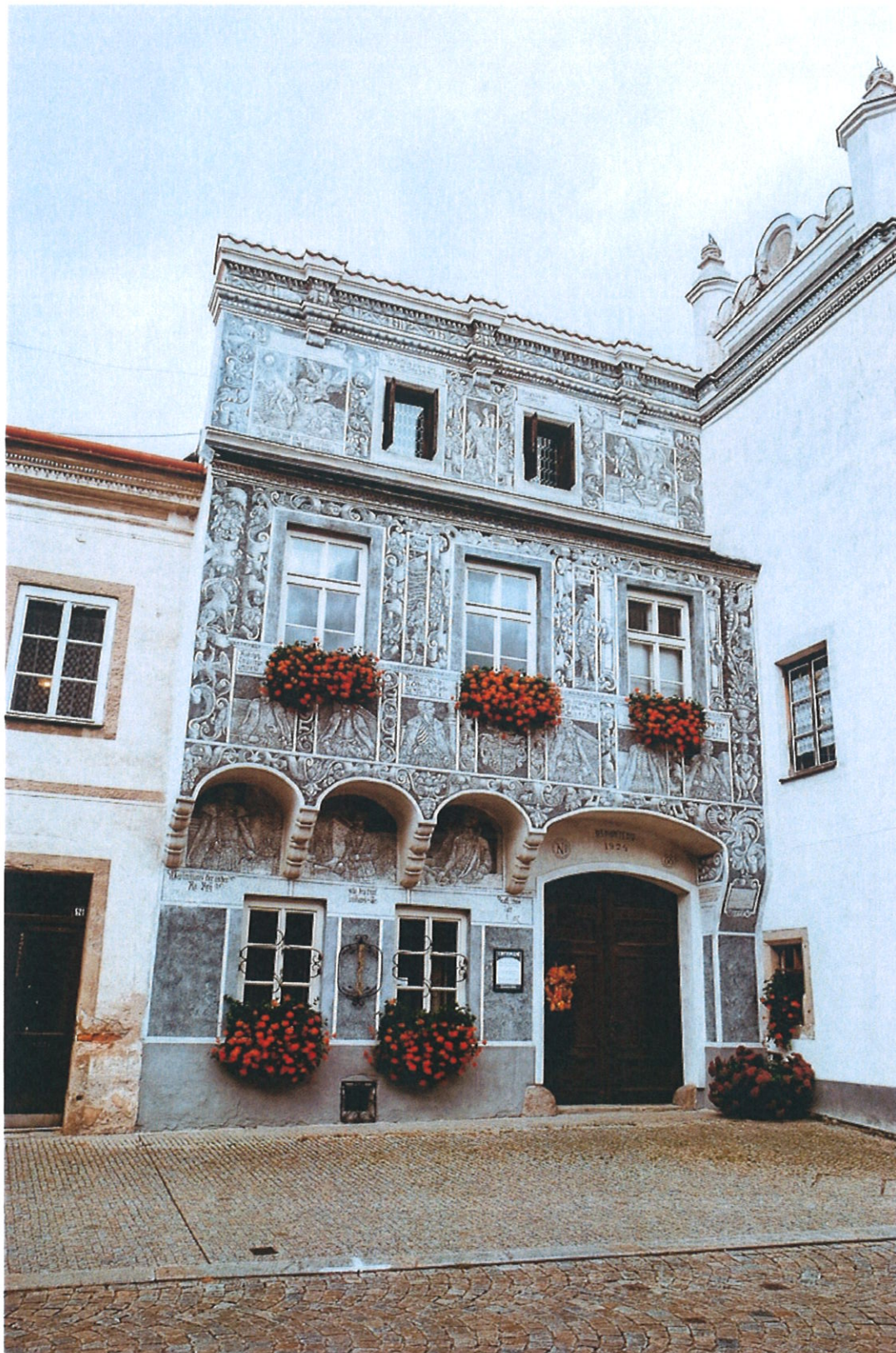
Dům v centru Slavonic

Pod centrem města je středověký podzemní komplex chodeb, které sloužily jako odvodňovací systém. Pouze malá část chodeb je přístupná veřejnosti, ačkoliv podzemí propojuje většinu sklepů domů okolo obou náměstí.