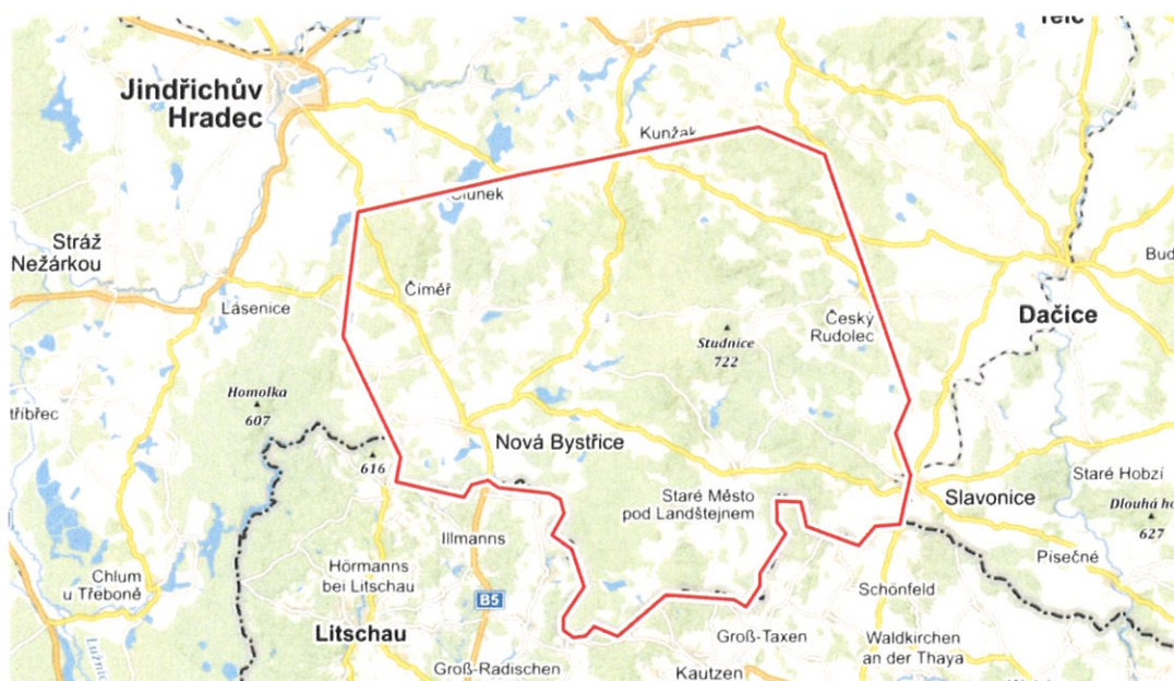
Dnešní oficiální území přírodního parku Česká Kanada

Přírodním parkem byla část historicky známé České Kanady vyhlášena v roce 2004 a najdete tu celou řadu měst a památek, mezi které patří známý hrad a zámek v Jindřichově Hradci, zřícenina hradu Landštejn a celá řada více i méně známých historických pamětihodností.