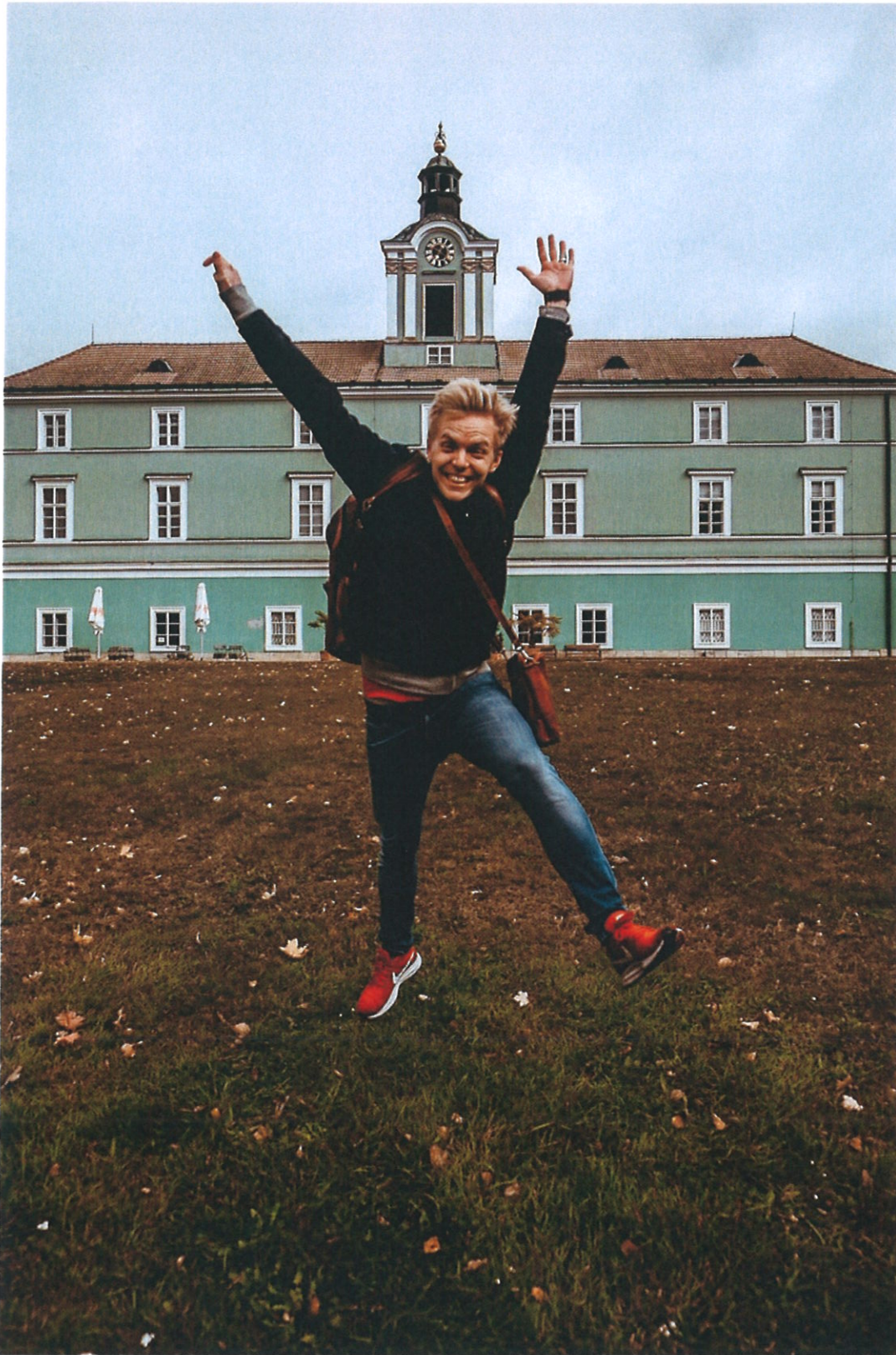
Dačický nový zámek

Nový zámek v Dačicích, vybudovaný v roce 1591, byl postaven Oldřichem Krajířem z Krajku. Zámek byl původně renesanční, v osmnáctém století byl novým majitelem přestavěn do barokního stylu a během devatenáctého století prošel přebudováním do stylu empíru.