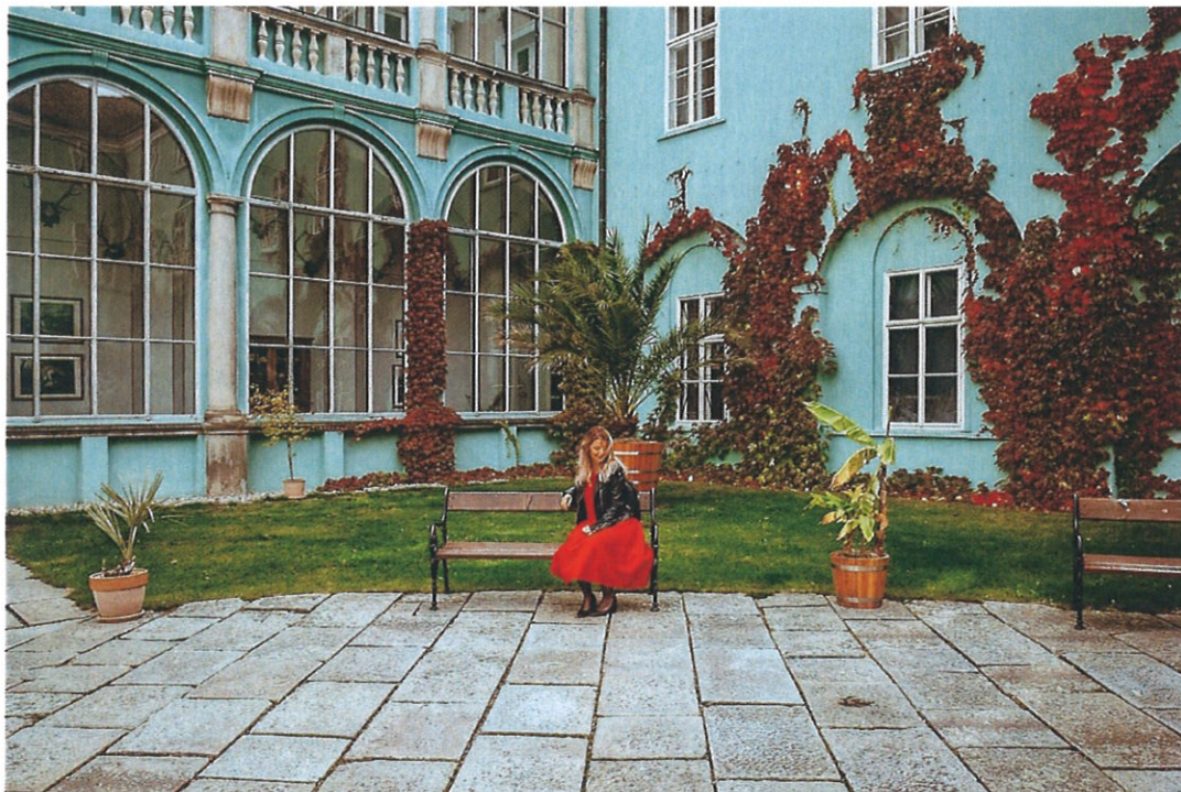
Nádvoří dačického zámku

V Dačicích najdete také tzv. „starý zámek“, který je spíše městský renesanční palác. Vybudován byl Albrechtem Krajířem z Krajku mezi lety 1572 až 1579 a je pozoruhodně zachovalý. Ve dvacátém století v něm sídlila radnice a od roku 1991 tu má kanceláře několik městských odborů.