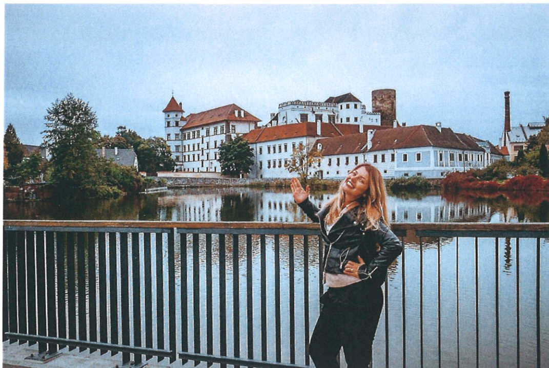
Zámek Jindřichův Hradec

Na zámku určitě navštivte tzv. „černou kuchyni“, která je nejstarší (teoreticky) funkční kuchyně na českých hradech a zámcích. Váže se k ní jedna z pověstí o bílé paní, Markétě Rožmberské, která v této kuchyni dohlížela na to, aby se každý Zelený čtvrtek navarila sladká kaše pro všechny chudé z Jindřichova Hradce.