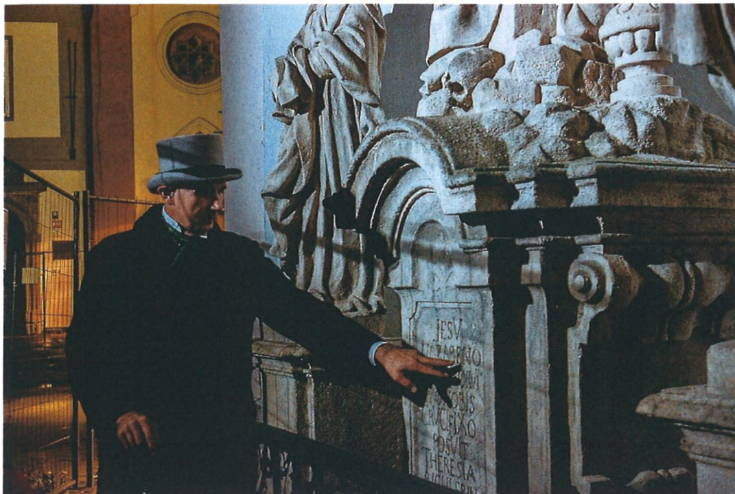
Komentovaná prohlídka formou příběhu s dobovým kostým a mluvou

Prosím, pokud sem někdy pojedete, jděte na komentovanou prohlídku. A pokud vám přijde komentovaná prohlídka jako nuda – není. Hltali jsme každé slovo našeho průvodce a chtěli jsme v Budějovicích zůstat alespoň týden.