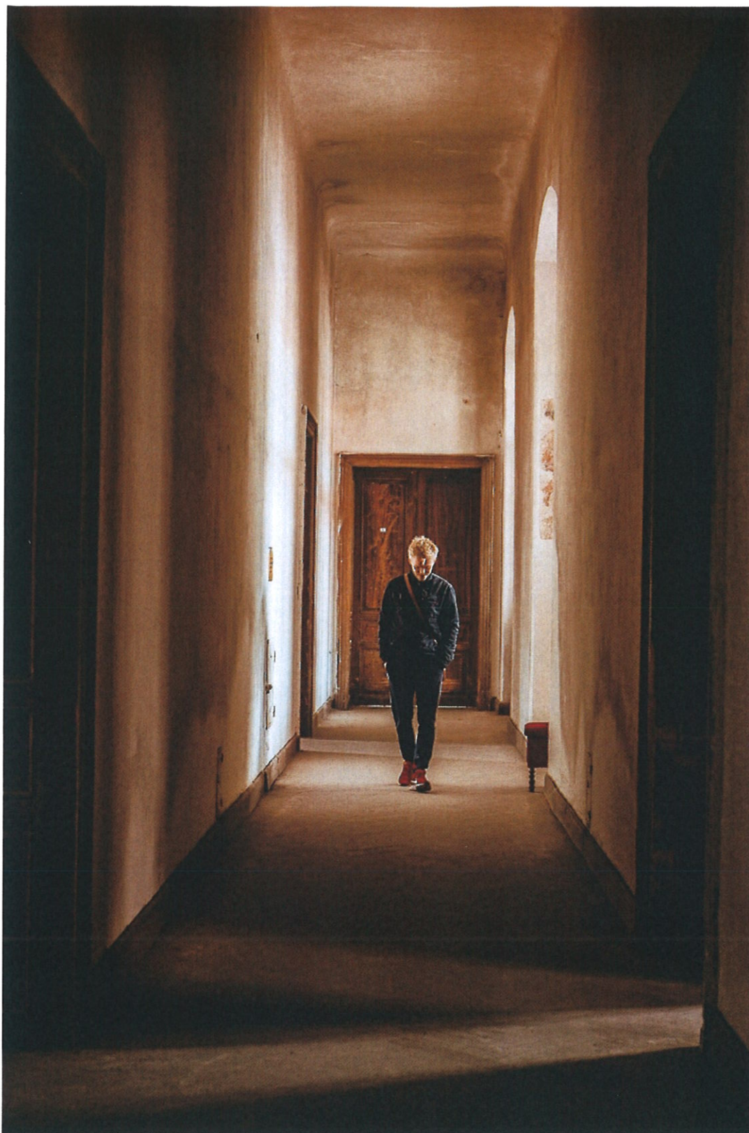
Jedna z chodeb v zámku