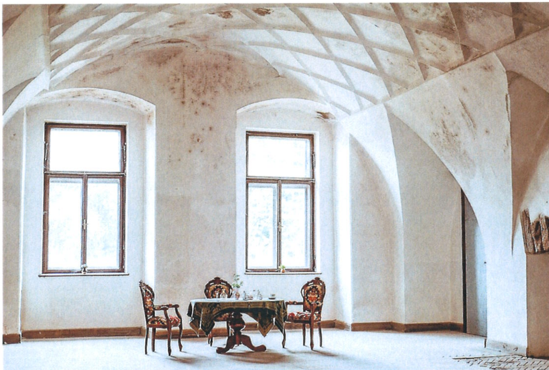
Interiér zámku v Nové Bystřici

Zámecký areál v Nové Bystřici je soukromý a hledá kupce, který by ho opravil a vymyslel pro něj kulturní využití. Pokud se chcete podívat dovnitř, musíte si domluvit prohlídku předem, ale rozhodně to stojí za to.