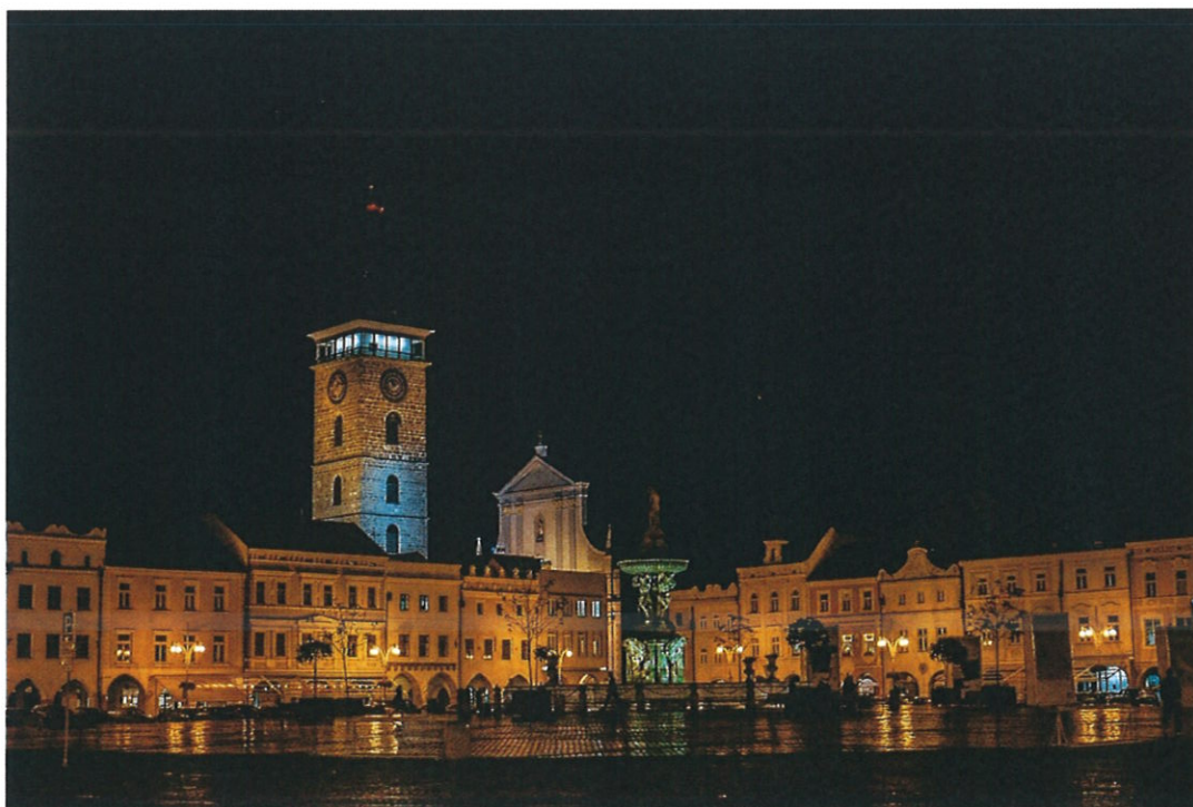
České Budějovice v noci

Dávná a magická historie je v centru Budějovic vpředena snad do každého dlažební kostky. ☺ Pro kavářenské povaleče je tu řada krásných podniků, které si určitě zamilujete.