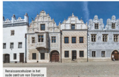
Renaissancehuizen in het oude centrum van Slavonice

“Deze tocht voert ons langs het mooiste deel van het Europese langeafstands-fietspad EuroVelo13.”