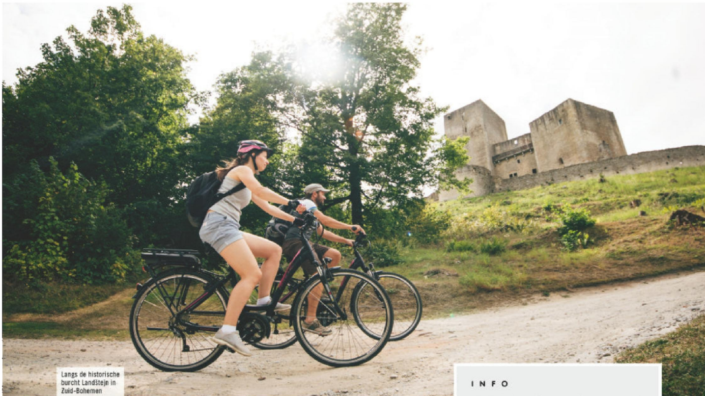
Langs de historische burcht Landštejn in Zuid-Bohemien

sned en langs het verloop zijn tal van burchten en burchtruïnes te zien en te bezichtigen. Het barokke Oostenrijkse Drossendorf, het beschermde dorpje Vratenin en het dorpje Safov met een van de oudste joodse begraafplaatsen in deze regio vormen slechts een paar hoogtepunten op dit deel van de Iron Curtain Trail. Het traject door het nationaal park Thayatal en Podyjí mag je gerust anspruchsvoll noemen. Op dit traject zijn we maar wat blij met onze trap-ondersteuning! Onderweg zien we meerdere overblijfselen van het IJzeren Gordijn; restanten die nog altijd ontzag inboezemen. Aangekomen in het dorp Hradiste hebben we een prachtig uitzicht op de burchtplaats Znojmo (duits: Znaïm). Een deel van deze gotische stad is op een heuvel gebouwd. De geschiedenis van Znojmo gaat in ieder geval terug tot de 9 e eeuw, toen op deze plaats al een burcht bestond. Znojmo is vaak het centrum geweest van burgeroorlogen,