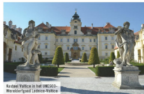
Kasteel Valtice in het UNESCO-Werelderfgoed Lednice-Valtice

Thaya Rivier In het tweede deel van onze tocht vervult de rivier de Thaya een centrale rol. De Thaya stroomt van west naar oost in het grensgebied tussen Oostenrijk en Tsjechië en is op vier stukken daadwerkelijk de grens tussen beide landen. Het dal van de rivier is op het eerste stuk - de bovenloop - diep uitge-