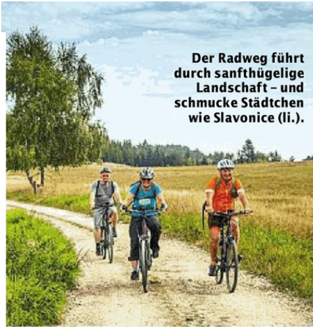
Der Radweg führt durch sanft hügelige Landschaft – und schmucke Städtchen wie Slavonice (li.).

Schrammelklang-Festival. Der Vater der legendären Brüder Schrammel, ohne die die Wiener Volksmusik heute kaum denkbar ist, kam im 19. Jahrhundert aus Litschau nach Wien. Und die Wiener Küche wäre ohne die vielen böhmischen Köchinnen nicht, was sie ist . . . So zeigt schon eine kurze Reise auf dem EuroVelo-13-Weg, wie willkürlich und sinnlos die „eiserne Trennung“ Europas über Jahrzehnte war. Die fast grenzenlose Freiheit (Pass oder Personalausweis müssen Sie schon bei sich haben!) ist ganz offensichtlich ein Gewinn, nicht nur für Ausflügler und Radfahrer!