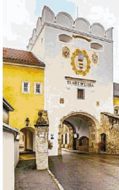
Ähnliche Stadtbilder: Weitra im Waldviertel (re.) und Slavonice in Südböhmen (u.).