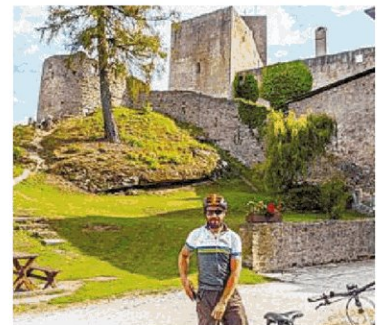
Burg Landstein erinnert an Böhmens mittelalterliche Geschichte – alte Bunker mitten im Wald an die jüngere ...

berg-Schloss und die schon 1379 gegründete Bohemia-Regent-Brauerei ebenso Besichtigungen wert wie die berühmte, riesige Karpfenzucht. Aber auch österreichische Orte haben profitiert. Litschau mit dem Herrensee, dem großen Hauptplatz und eindrucksvollen Stadtmauer-Resten, lag jahrzehntelang am „Ende Westeuropas“ – jetzt pilgern jährlich viele Tausende zu seinem Theater- und dem