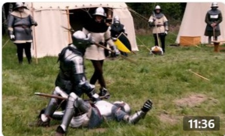
Archeoskanzen Trocnov - aktivity v letech 2018 - 2020

Výstavba Archeoskanzenu Trocnov (05/2020 - 05/2021)