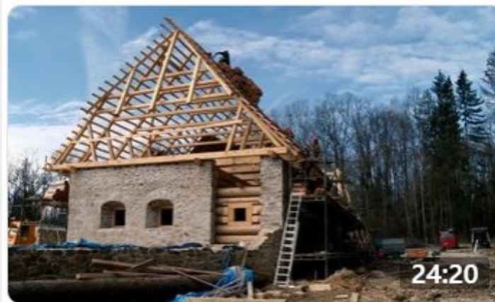
Časoběrný dokument o výstavbě Archeoskanzenu Trocnov (05/2020 - ...