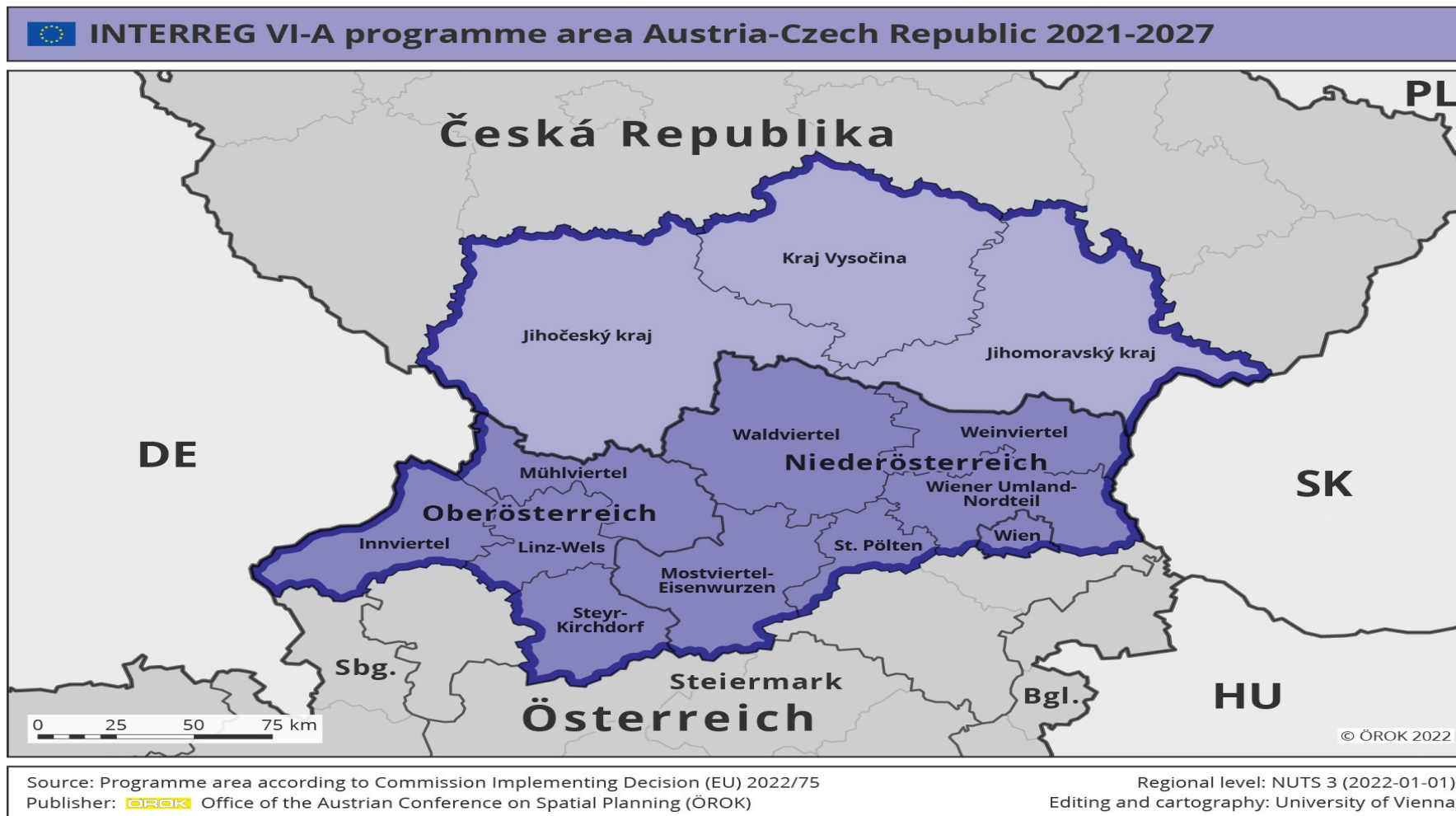
Figure 1: Programme area Interreg Austria – Czechia 2021-2027