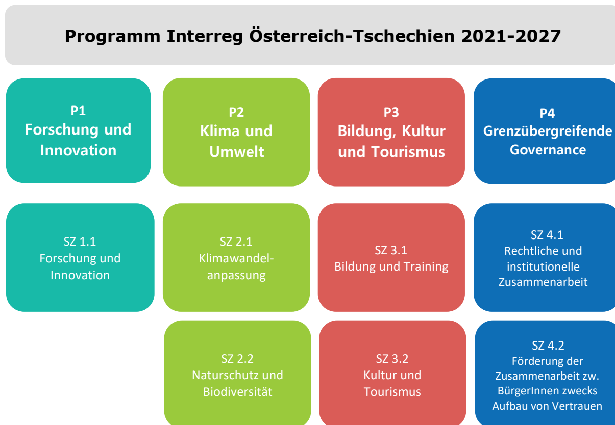
Abbildung 3: Prioritäten und Spezifische Ziele

Das Programm Interreg Österreich-Tschechien 2021-2027 fördert Projekte entlang von vier thematischen Prioritäten (P). Diese gliedern sich wiederum in sieben Spezifische Ziele (SZ):