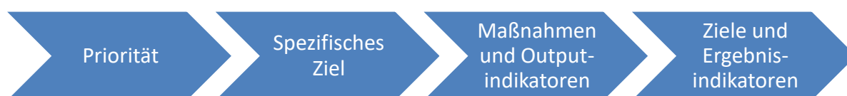
Abbildung 4: Interventionslogik

Die Interventionslogik des Programms zeigt, wie die geförderten Maßnahmen auf Projektebene zur Lösung von Herausforderungen im Programmgebiet, die im Zuge der Programmierung auf Basis von regionalen Analysen definiert wurden, beitragen und welche Ergebnisse des Programms insgesamt erwartet werden können. Für jedes Spezifische Ziel wurde ein erwarteter Beitrag sowie konkrete Maßnahmentypen zur Zielerreichung definiert. Es muss eine logische und klare Verbindung zwischen der Interventionslogik des Programms und den Ergebnissen und Outputs der finanzierten Maßnahmen auf Projektebene bestehen.