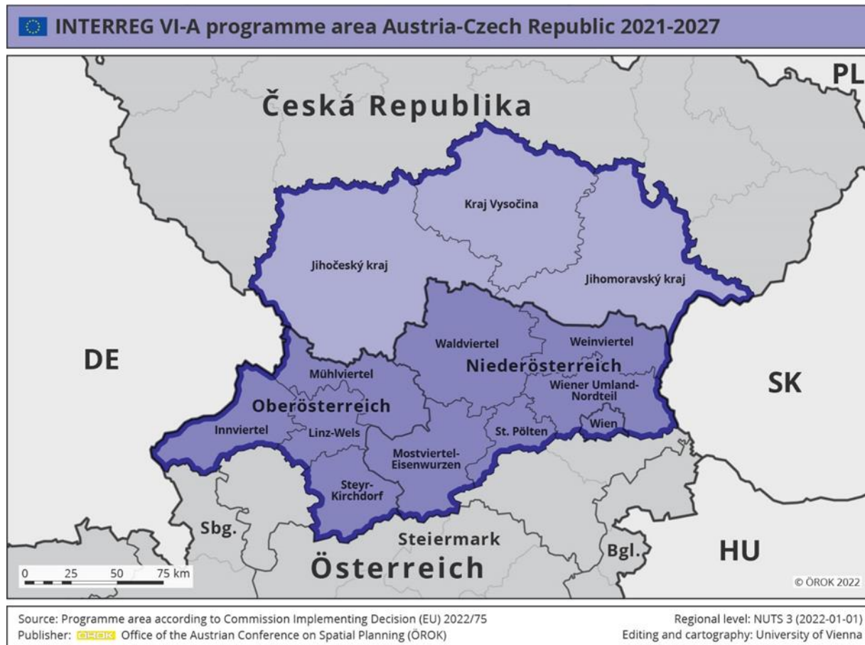
Abbildung 2: Darstellung des Programmgebietes

Für das Programmgebiet sind zwei makroregionale Strategien (EUMRS) relevant: die makroregionale EU-Strategie für den Donauraum (EUSDR) und die makroregionale EU-Strategie für den Alpenraum (EUSALP). Via die Verknüpfung mit der EUSDR und der EUSALP soll das Programm eine größere Wirkung (auf ein größeres Gebiet) erzielen sowie gute Projekte mit optimaler strategischer Einbettung und großer Sichtbarkeit generieren.